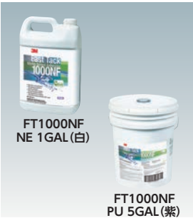
FT1000NF NE 1GAL(白)